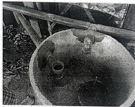
ตำบลหลุบ